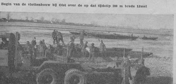
Begin van de vlottenbouw bij Olst over de op dat tijdstip 200 m brede IJssel