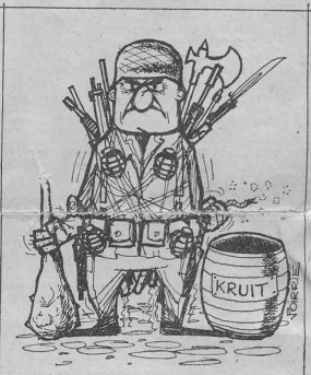
Deze krijger was bereid zich tot het uiterste tegen de terreur-acties van de Commando-troepen te verdedigen

abnormaal hoge waterstand maakte dit natuurlijk dubbel moeilijk. De mannen van 480 Geniegroep (kern) leverden een prachtig stukje werk en het was wel spijtig dat de veerman van het uif de vaart genomen burgerveer bij Olst vriendelijk lachend de duiten opstreek van de klan-