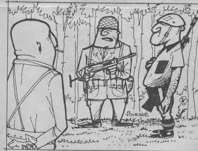
Wachtpost met gevangene tot officier: „Hij zegt dat hij tot de „Plov-div“ hoort en opdracht heeft zich naar Eindhoven te verplaatsen“

voor dat via verzamelgebieden bij Epe en bij Rechteren de colonnes zonder veel oponthoud en zonder elkaar te hinderen hun weg konden voortzetten. Ook bij deze operatie was de hoge waterstand van de IJssel een extra handicap, wat niet wegneemt dat de vlotten aan het gestelde doel beantwoordden en de zogenaamd verwoeste IJsselbruggen enigszins wisten te vervangen. Ongeveer 200 man van 125 Munavlecie en 110 Gnrstcie hadden (op papier althans) verblijf gehouden in gebied dat met radio-actieve neerslag besmet bleek. Dat leverde hun een welkome warme douche op onder de ISNY, de nieuwe bij 103 Intendance Bataljon in beproefing zijnde semi-mobiele badinstallatie. Na de eerste berichten was deze via het militaire veer bij Olst naar Bathmen getransporteerd, waar de mannen van 136 Werktroepen Compagnie aan de modderige oever van de oude Schipbeek ter hoogte van de Pothaarsbrug in het nachtelijk duister voor de montage zorgden. De ontsmetting bestond behalve uit het douchen in de heerlijk verwarmde tent ook nog uit vervanging van alle kledingsstukken. Ondanks