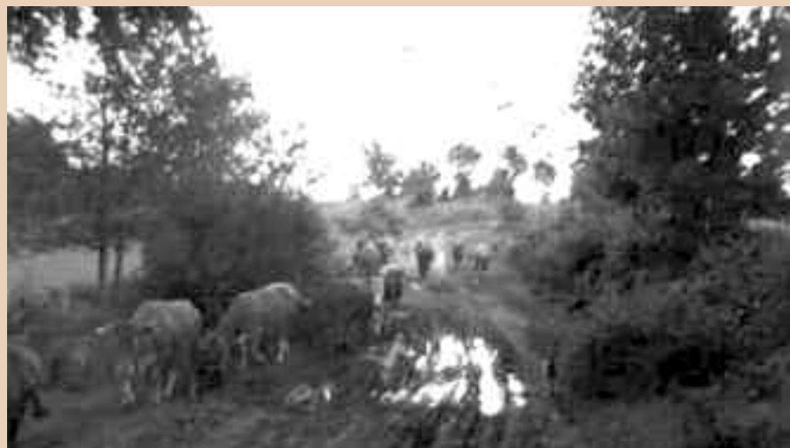
Vijandelijke tanks in het voorterrein...