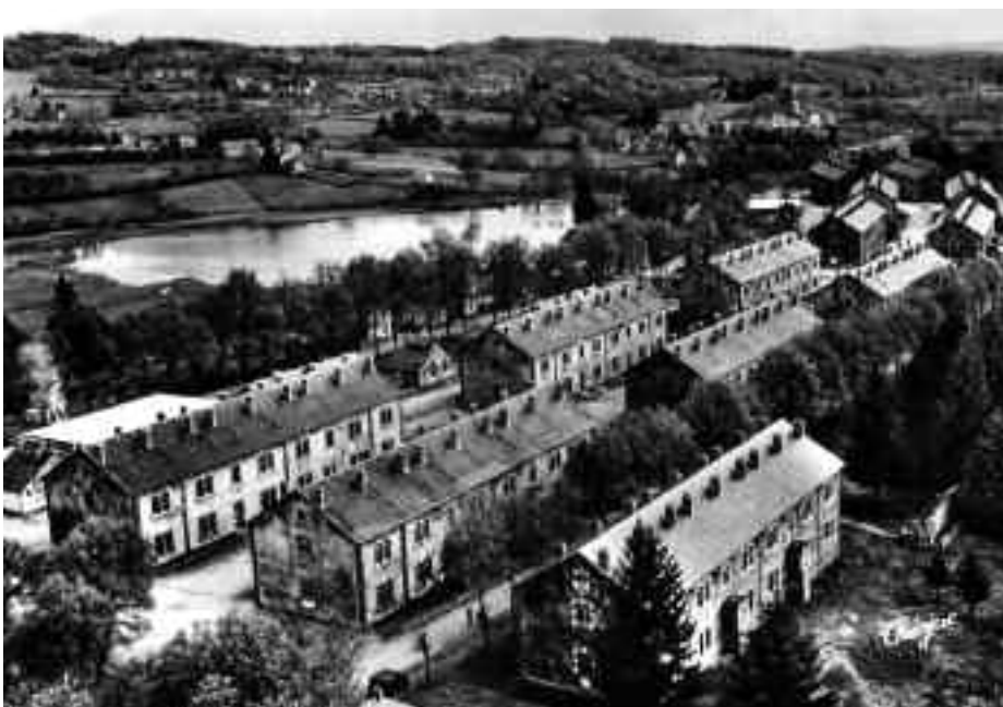
'Ilot' C (voorgond) en D. Op de achtergrond Lac de Gratadour

In de eerste week van de oefenperiode lag