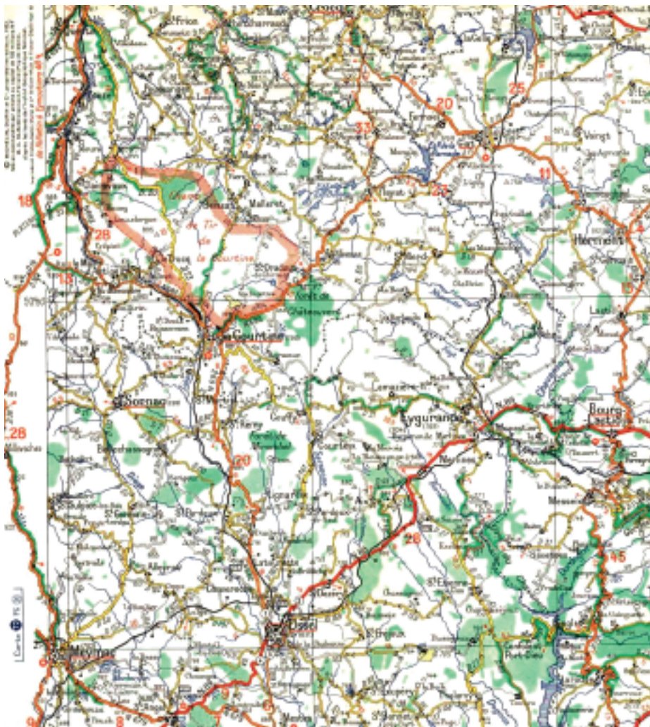
De ligging en omvang van het oefenterrein La Courtine

Het Ministerie continueerde de samenwerking met de Fransen tot en met 1964 omdat er zich vanaf 1965 weer oefenmogelijkheden in Duitsland aandienen. Dat kwam goed uit. Enerzijds omdat de terreinomstandigheden in het oefengebied absoluut niet overeenkwamen met die van het oorlogsgebied en anderzijds bleek het terrein minder geschikt te zijn om er met pantservoertuigen (AMX en YP-408) in te opereren. Bovendien vormde de grote afstand La Courtine - oorlogsgebied een bedreiging