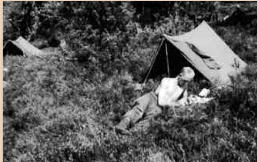
Rustdag te veld