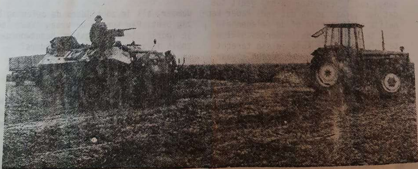
Verbroederlijk naast elkaar: de M van 13 Pantserbat en de Duitse traktor

De vijand laat ondertussen nog op zich wachten. Terwijl de regen onverminderd naar beneden valt, stijgt de spanning langzaam maar zeker. De enige die nergens last van lijkt te hebben is de boer, die pal naast de pantservoertuigen onverstoorbaar zijn suikerbieten uit de grond haalt.