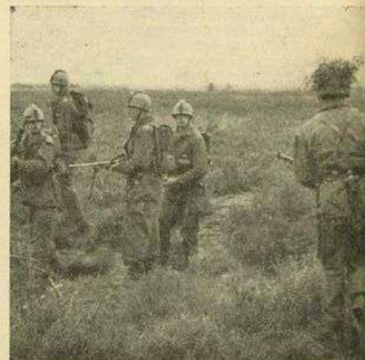
Kruiddamp op de Oirschotse heide tijdens het eerste grote gevecht van „Hordenloop”

Nog ijverig stonden deze met kammen op de helmen gesierde vijanden” (A-45 Infbat „Oranje Gelderland”) op de Oirschotse heide losse flodders af te schieten, toen een flankaanval door de voorhoede van 42 Bataljon Limburgse Jagers hen verraste en zij zich als krijgsgevangenen moesten laten afvoeren