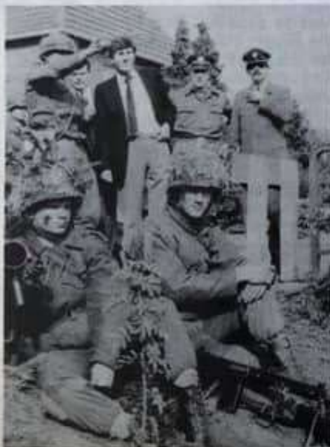
Dra. Lubbers probeert de vijand in het achterveld te ontdekken.