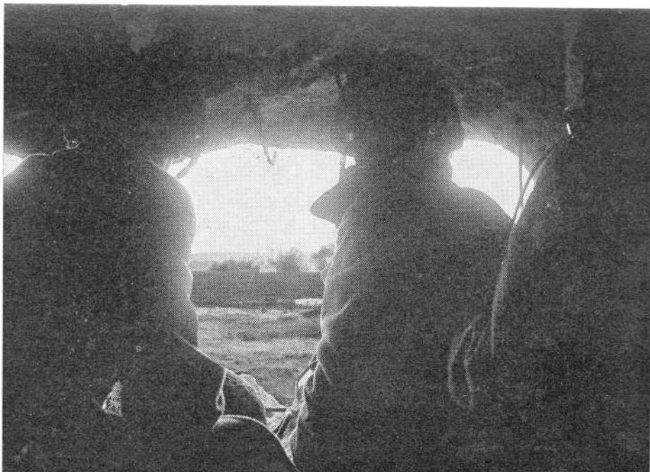
De waarnemers in een bunker kijken waar de granaten vallen

„Waarde 3300 gulden“ staat op deze „kachelpijp“, waarmee overigens over een afstand van 4,5 km een zeer nauwkeurig vuur kan worden afgegeven met de brisantgranaten van 12 kg elk. De looŕ van deze zware mortier 4.2 inch is voorzien van trekken en velden