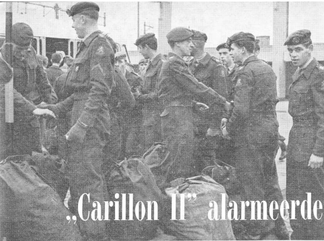
Weerzien van de oude kameraden voor het station Eindhoven