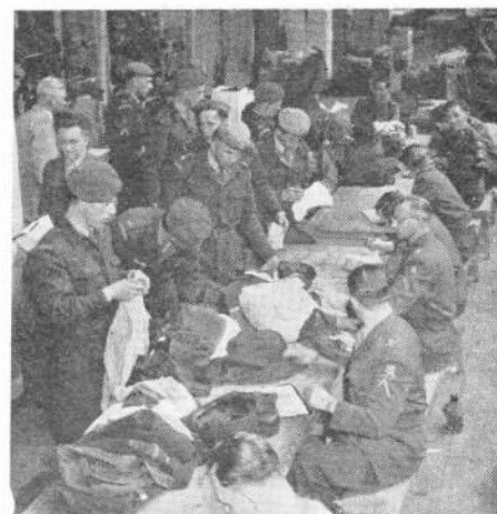
Deskundige ogen bekijken de P.S.U.