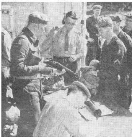
Wapens worden in ontvangst genomen

KEREN wij terug naar de legerplaats Budel, waar alles op deze mooie voorjaarsdag als op roltjes liep. In een der grote loodsen was het P.D.P., het plaatselijk depot PSU, ingericht door de goede zorgen van de Intendance compagnie Zuid uit Breda. Zo'n depot is in feite één groot warehouse, waar men alle artikelen welke tot de persoonlijke standaarduitrusting van de soldaat behoren in veelvoud vindt opgestapeld.