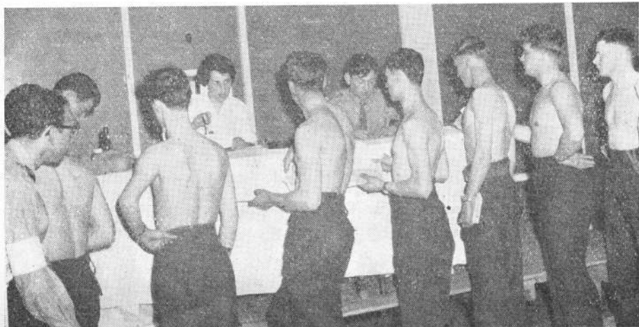
In de rij voor de doorlichting

Zo werd in dit PDP nauwgezet de PSU van elke dienstplichtige aangevuld of vernieuwd. Daarna moesten de wapens in ontvangst worden genomen, gasmaskers en andere nuttige zaken en aan het einde van deze drukke dag waren de meeste soldaten gereed om met het oefentableau, dat de volgende 24 dagen in beslag zou nemen, te beginnen. R.