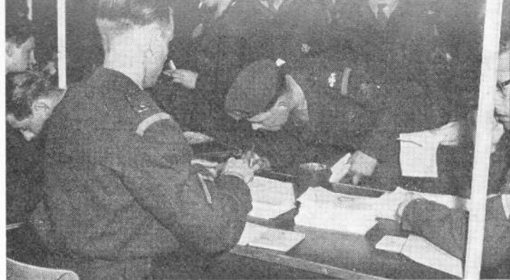
Druk werk voor de administrateurs

Hij is op deze eerste dag door de administratieve molen gedraaid. De volgende dag moet hij met zijn onderdeel gaan oefenen. Maar daarvoor is nodig (taak van de S 4) dat alles bedrijfsklaar aanwezig is om deze oefeningen mogelijk te maken. Dus: wapens, voertuigen, radio-toestellen, keukenuitrusting. In de voorafgaande weken is een ontzaglijke stroom van materieel uit de mobilisatie-opslagplaatsen naar de opkomstcentra gevloeid. Dit waren niet alleen tanks en kanonnen, maar ook de onderhoudsmiddelen tot en met het flanellen lapje voor het doorhalen van het geweer. Dat waren drittonners en jeeps, baily-materieel, maar ook chirurgische apparatuur, tandartsbenodigdheden enz.