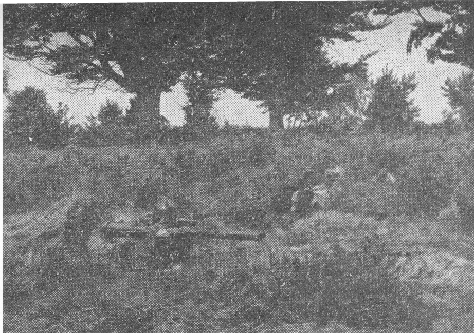
Leerzame oefeningen in fantastisch terrein

de la Mairie). Hartelijke kleine kerel met meteen een bekertje rode wijn over de tapkast. De burgemeester was de rijkste boer van het dorp-stadje. Zoiets is toch een stukje oefening, dat we elders nooit meemaken. Fantastisch! Ons hoofdkwartier was natuurlijk bij Monsieur le Secrétaire!