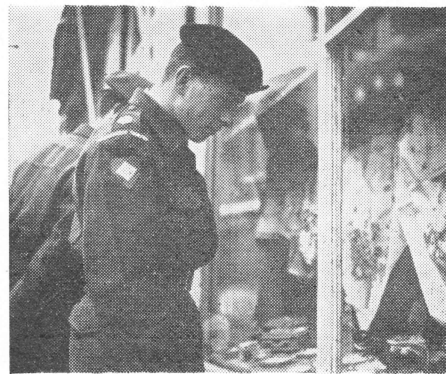
Eerst goed kijken, dan kopen

te geven weer op de weg te komen. Deze op het eerste gezicht nogal voor de hand liggende raad werd gegeven omdat uit bestudering van voorgekomen ongelukken was gebleken dat veelal in deze hoek de fout had gezeten.