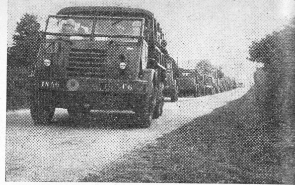
Vertrek van de kwartiermakers naar Bourges op 1 november

ZONDAG 1 november vertrokken de kwartiermakers voor de verschillende stopplaatsen op de weg naar Nederland — te Bourges en Mourmelon — al naar het noorden. Het betrof hier voornamelijk mannen, die in de stopplaatsen tevoren gereed zouden moeten staan om te helpen bij het tanken van de grote karavaan van de volgende dag. De terugtocht naar Nederland geschiedde verspreid over de eerste 9 dagen van november. Met het vertrek vielen o.m. ook de laatste loodjes op te knappen van het detachement van 102 Technische dienst bataljon. Het detachement, dat 5 maanden in La Courtine heeft gezeten (10 dagen verlof gehad) en dat gemiddeld een 300-tal werkopdrachten per maand uitvoerde, restte nu nog een 60-tal wagens met chassisbeschadigingen op de trein te zetten benevens de gebruikte tanks — 60 in totaal —, tanktransporteurs, bulldozers en dergelijk zwaar materieel! Op maandag 2 november opende het 45 Bataljon infanterie als eerste de grote uittocht uit La Courtine.