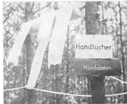
Van grote rollen scheurt men een „handdoek” af om zich na het douchen te drogen. Het papier wordt na gebruik in een kuil geworpen en begraven