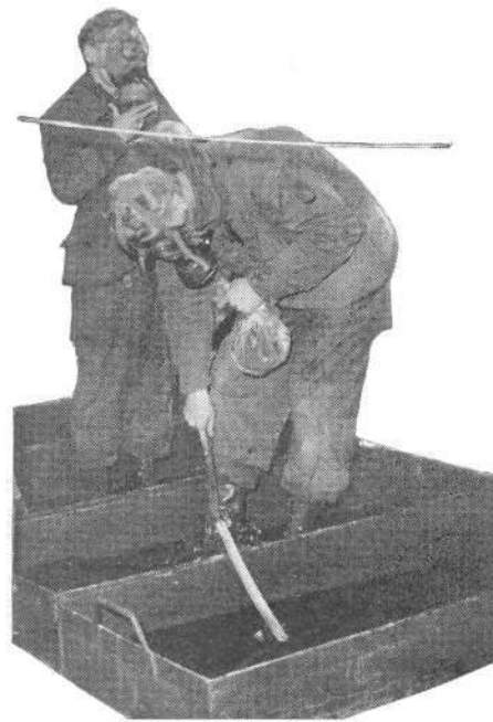
In vier achtereenvolgende bakken de schoenen wassen met water