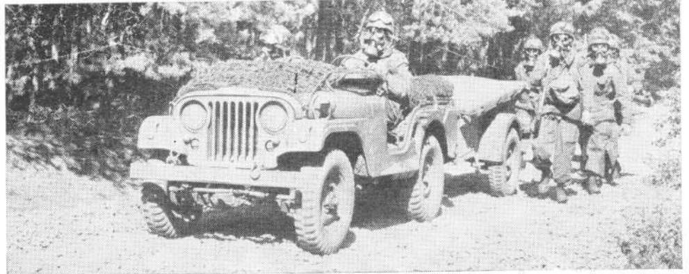
Met gasmaskers op de ontsmettingsplaats binnen

Op zichzelf werd het een interessante zaak en voor wie het onderging daarbij nog een ongewone gewaarwording. Langs een witte band afgezet pad gingen de „besmetten” groep voor groep langs opeenvolgende posten: eerst langs een man die met een Geigerteller controleerde of men inderdaad besmet was, daarna werd men bespoten met een nevel, teneinde de stofdeeltjes op de overkleding vast te