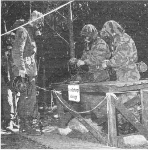
Het afgeven van de uitrusting, welke ontsmet moet worden