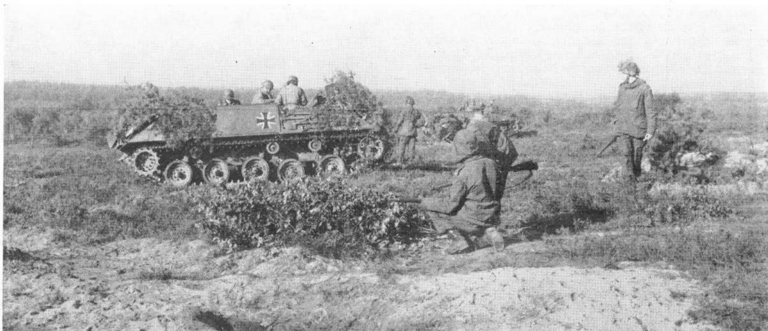
De Duitse gepantserde voertuigen zijn tot de Nederlandse opstellingen genaderd