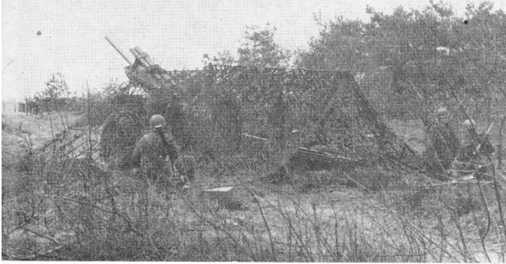
Een 155 hw van de C-batterij 14 Afdva in stelling

K LOKSLAG twaalf uur in de nacht van woensdag 8 op donderdag 9 februari rinkelde de telefoon in de kamer van de dienstdoend officier in de WGF-kazerne te Harderwijk. En dat was het simpele begin van een uitgebreide alarmoefening genaamd „Gans”, waarbij tal van onderdelen van 4 Div. werden betrokken. Wij noemen o.a. de volledige staf van de divisie en van de divisie artillerie, het 41 Verbindingsbat., verbindings-detachementen der brigade-staven, 14 en 19 Afdva, de 41 Marcie, het 298 Squadron lichte vliegtuigen en enkele kleinere eenheden. Bij elkaar ongeveer 2.000 man en 400 voertuigen.