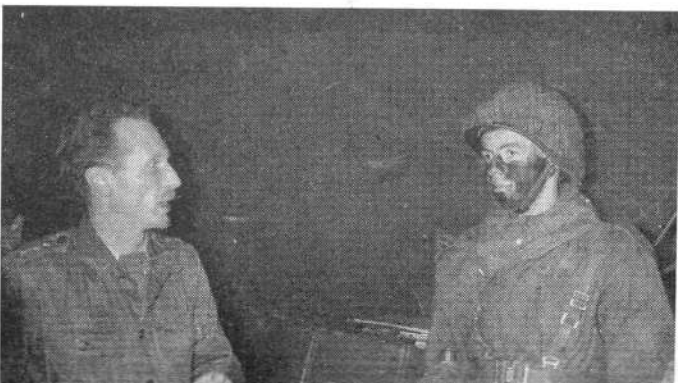
Geen winterslaap met de vleurmuizen, maar een en al bedrijvigheid bij de militairen in de gangen van Cadier en Keer