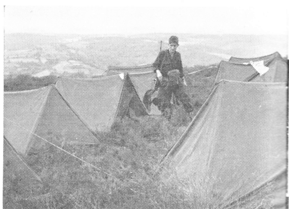
Bivak van 51 Afdva bood prachtig uitzicht.