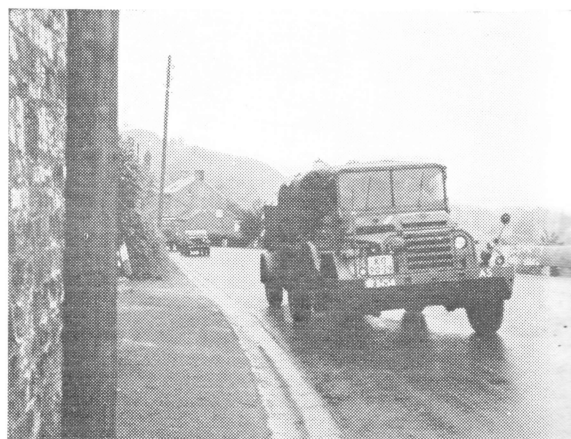
De grote trek naar la Courtine: doortocht door België