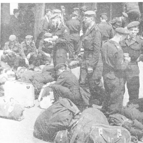
Zo begon het, in Budel of Mill