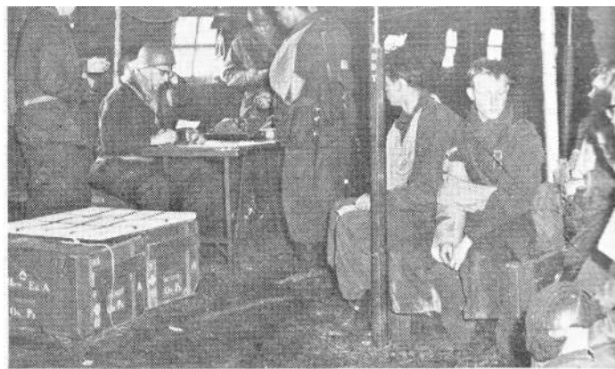
Registratie van gewonde militairen in de opname-tent van het v

Bovendien waren, om zowel de verbandplaats als het veldhospitaal volledig te bezetten, een aantal specialisten opgeroepen, zoals chirurgen, narcotiseurs en tandartsen.