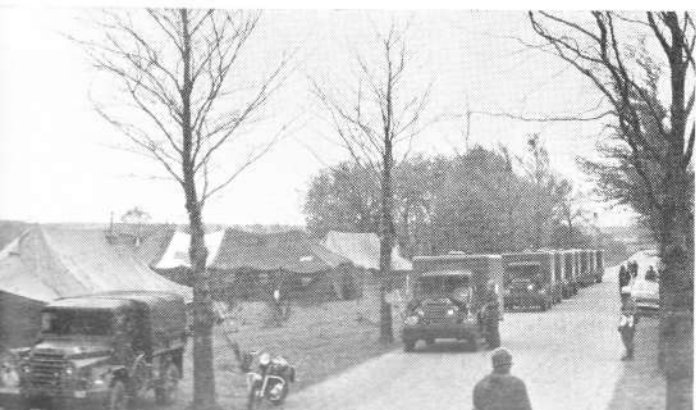
Ziekendragers aan het werk in de verbandplaats te Valkenburg.