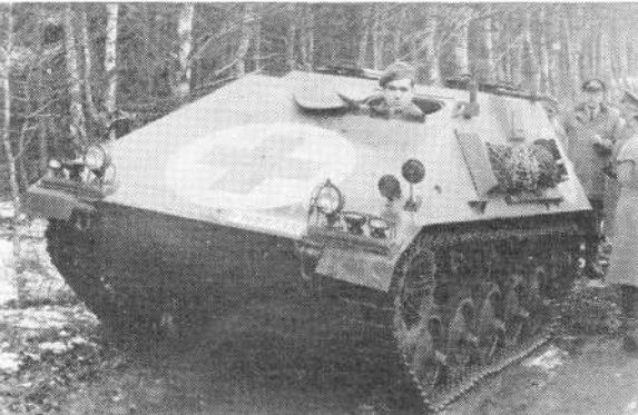
Duits gepantserd terreinvoertuig voor het bergen van gewonden

behorend tot een in Hamburg gelegerde Duitse pantserdivisie. De Duitse compagnie telde ongeveer 180 man personeel en had hier een hoofdverbandplaats ingericht, met ABC-sluits, waardoor dus alle aangevoerde gaspatiënten werden gevoerd.