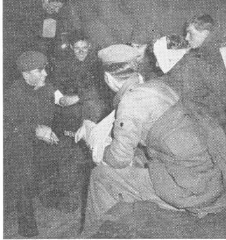
„Conventionele” gewonden van 16 Painfbat in de Duitse verbandplaats

E EN verbandplaats was ingericht door 11 Gnkbat, de andere door een compagnie van het geneeskundig bataljon,