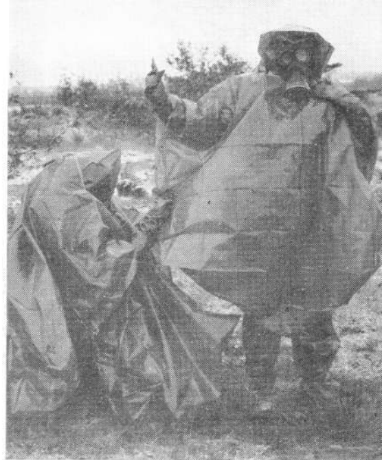
De polyester overgooier wordt vastgemaakt

Als vormloze groene verhogingen lagen deze mannen onder de beveiligende kunststof, trokken liggend overlaarzen en handschoenen aan, zetten hun gasmaskers op,