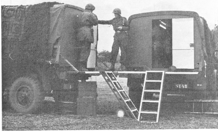
Exterieur van het divisie-VRC

waarna een geconcentreerd vuur der gehele divisie-artillerie volgde, dat zeer goed lag.