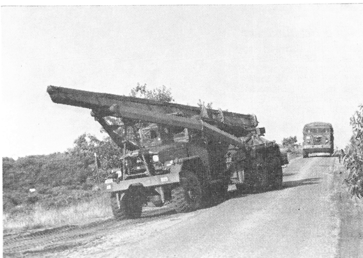
De Honest John komt de divisie-artillerie completeren

BIJ wijze van proef is tijdens de oefening Vuursteun III gebruik gemaakt van een mobiel vuurregelingscentrum voor de divisie-artillerie, dat met eigen middelen werd ingericht in twee DAF drietonners, waaraan overigens niets mocht worden veranderd. In beide wagens