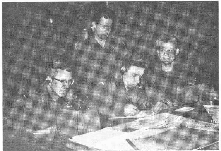
Mannen van het VRC van 12 Afdva aan de arbeid

WIJ spraken tijdens en na afloop van „Vuursteun III” zowel met kolonel Witsenburg als met de DAO, luitenant-kolonel Prins. Zij vertelden ons dat snelheid en teamwork nummer één waren bij deze oefening. Men heeft daarbij min of meer vooruitgegrepen op de gemechaniseerde artillerie, die wij volgend jaar zullen bezitten: de AMX met 105 mM vuurmond, ter vervanging van de 25 ponders, die een kaliber hebben van ongeveer 90 mM. Onze afdelingen lichte artillerie zul-