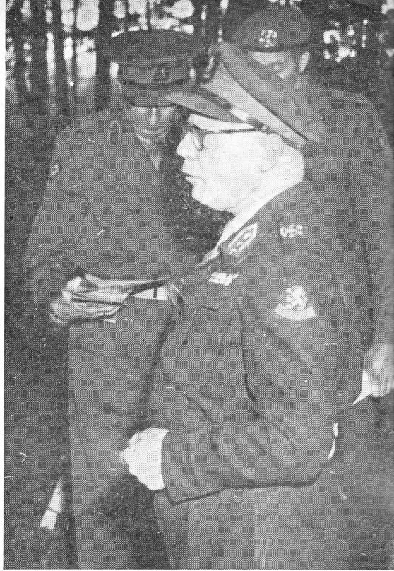
Luitenant-Generaal A. T. C. Opsomer, commandant 1 L.K., te velde tijdens „Battle Royal”.

DUIDELIJK is aangetoond hoe bij opmars over een breed front snel succes wordt verkregen, doordat men de punten waar de vijand weerstand biedt omgaat en hem in de rug komt,