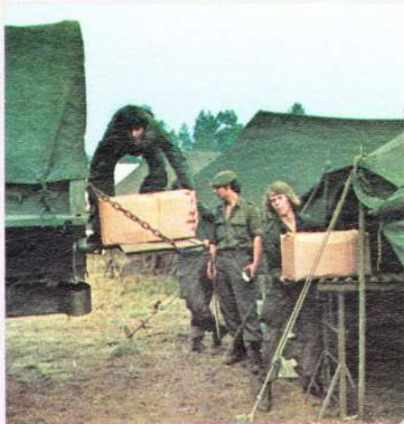
Bij de foto's Links: Een van de eerste klapstukken: in de vroege ochtend neemt 103 Verkenningbataljon de Aller

Maar het legerkorps bracht dan ook even een wereldprimeur daar op de Noordduitse laagvlakte tussen Hamburg, Bremen, Hannover en Braunschweig. Het Anglo-Amerikaanse CPI-systeem vond voor het eerst toepassing bij een troepen oefening van deze omvang. Nederland beproefde de free battle. Waar groen en blauw op elkaar botsten berekenden scheidsrechtters de waarde van beide partijen; factoren als verrassing, artillerie- en luchtsteun, terrein e.d. zorgvuldig in cijfers omzettend. Met hun beslissing – bijvoorbeeld: groen moet met een snelheid van x kilometer per uur terugtrekken – konden brigade- en divisiecommandanten het doen. En niet met een tot catechismus verheven draaiboek. De mening van scheidsrechtters en strijders liep de eerste dagen nogal uiteen. Daarna overheerste het enthousiasme. Generaal Meijnderts tijdens een nachtelijke persbijeenkomst: 'Bij een geleide oefening zeggen we steeds: 'Pas op, als je één tank ziet moet je net doen of het er drie zijn.' Daar zijn wij verrekt goed in. Het draaiboek zegt, dat een bepaald kruispunt bezet is. Dan wordt een compagnie daar tegengehouden ook al zien ze geen vijand. Kijk: dat maak je de spelers niet duidelijk. Ik wil juist: één tank is één tank. En niets is