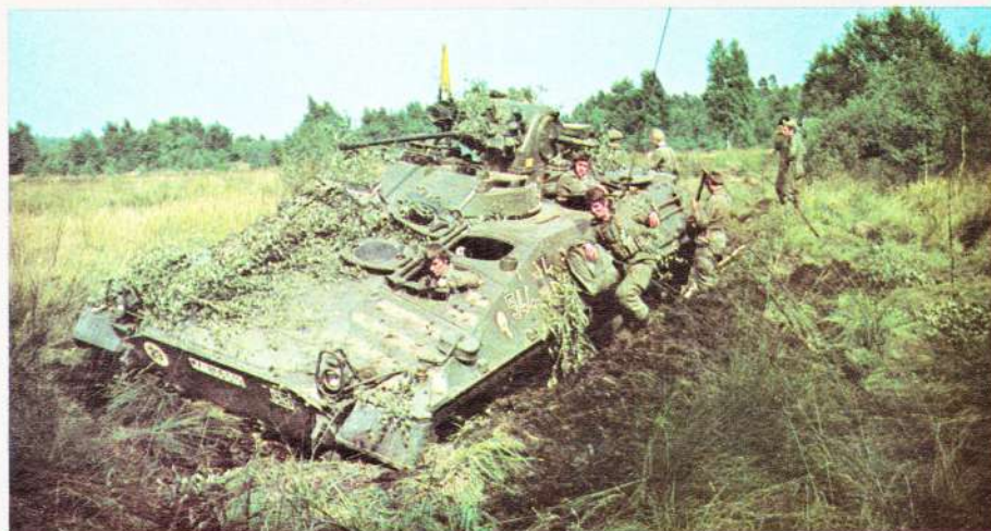
Rechts: Een weggezakte Duitse pantser- wagen: het uitblijven van regen maakte dergelijke beelden zeldzaam