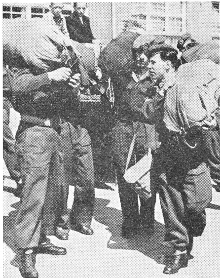
Ontmoeting van oude kameraden, bekend beeld van de oefening „Drietand”

Overigens deelen zich merkwaardige staaltjes van activiteit voor. Wij zullen er een paar vermelden. Een militair van 32 R.I., werkzaam aan een vliegveld aan de Belgisch-Franse grens, hoorde 's morgens 7 uur in de Nederlandse radio de oproep. Des middags te 17.00 uur was hij gepakt en gezakt aan de school Escamplaan te 's-Gravenhage. Een boerenjongen uit