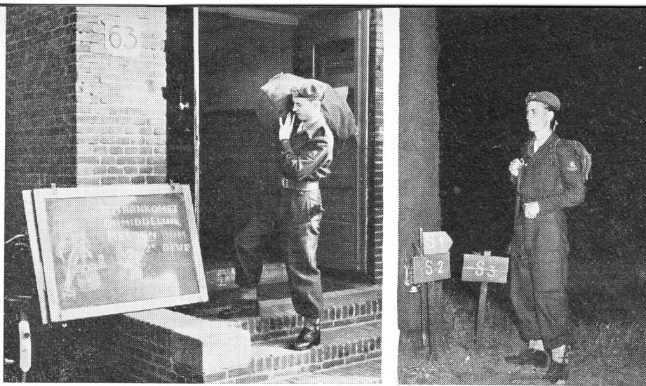
's Maandags meldde deze vaandrig zich als een der eersten; 's Zaterdags ontmoetten wij hem wéér, heel toevallig, bij de commandopost van 32 R.I. te velde.

R.I. had zich zó voortreffelijk onzichtbaar en geluidloos ingegraven, dat men aan de andere zijde daar niets van had gemerkt en in de waan verkeerde met een „vergeten” stukje front te doen te hebben. Hier werd dus een oversteek gewaagd, maar dat liep verkeerd af. De meeste infiltranten werden krijgsgevangen gemaakt en slechts enkelen slaagden er in te ontsnappen.