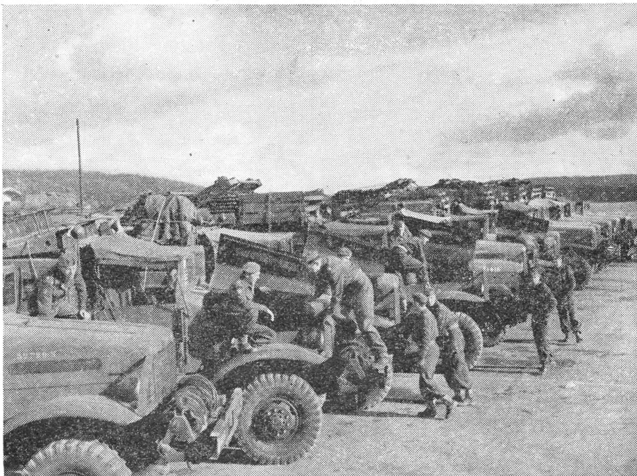
De Genie was met groot materieel uitgerukt