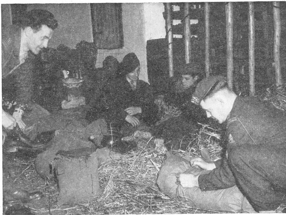
Kijkje in een der oordbivaks nabij Assen

mannen van 3 Div. lagen, diep verzonken in hun onvolprezen slaapzak, op één oor.